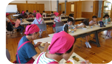
8/2(金) りょうり教室 びっくりするほどおいしいカレーができたよ