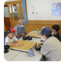
7/29(月) いご・しょうぎ体験会 名人めざしてがんばろう