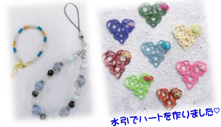
水引でハートを作りました♡