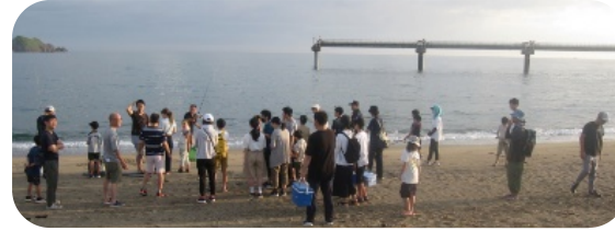
7/20(土) 早朝キスつり大会 朝5時30分集合 自分で釣ったキスの天ぷらは最高