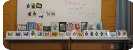
7/31(水) きりえ教室 色とりどりのステキな作品が完成★